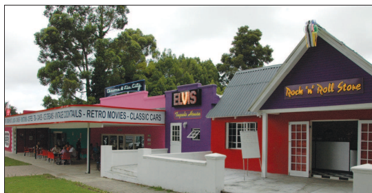
'n Plek gevul met nostalgie.