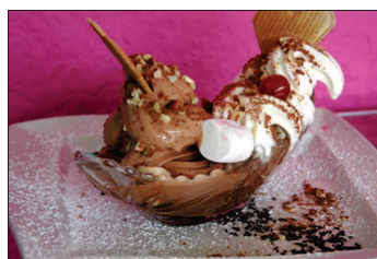
Die regte Amerikaanse burgers, banana splits (piesangroomys) en vet slaptjips by Marilyn's 60's Diner laat jou mond water, so saam met Elvis Presley se stem wat op die straat uitspoel.