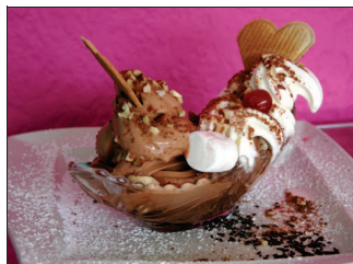
Die regte Amerikaanse burgers, banana splits (piesangroomys) en vet slaptjips by Marilyn's 60's Diner laat jou mond water, so saam met Elvis Presley se stem wat op die straat uitspoel.