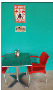
Die Elvis-diner voer jou terug in die tyd.